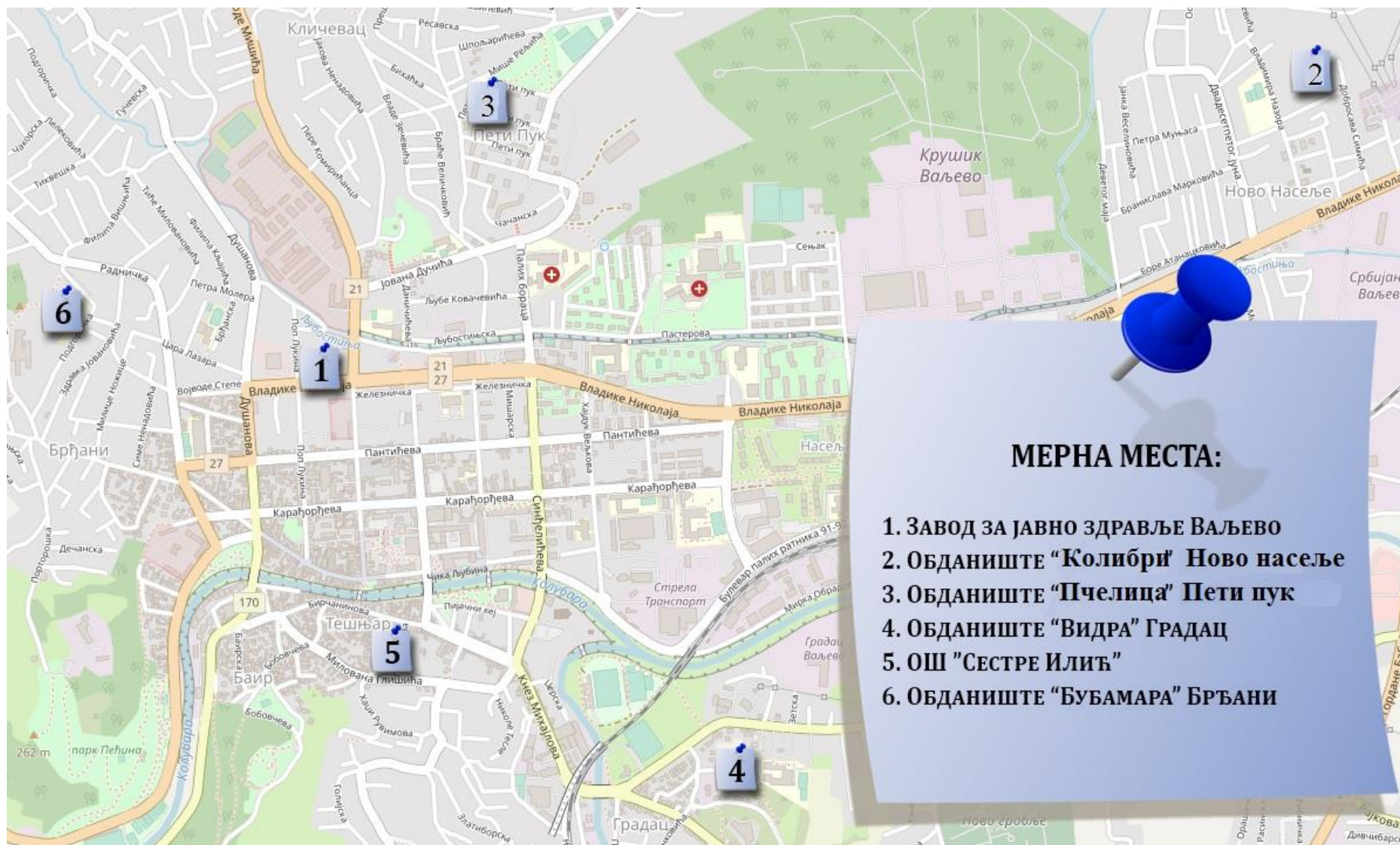
Мапа града Ваљево са уцртаним позицијама мерних места